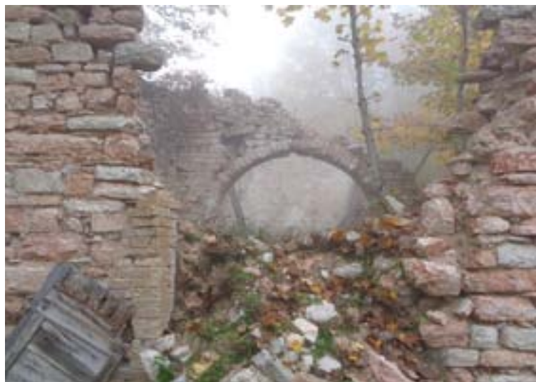
Resti della chiesetta della Romita di Monte Cavallo