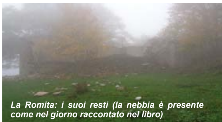
La Romita: i suoi resti (la nebbia è presente come nel giorno raccontato nel libro)